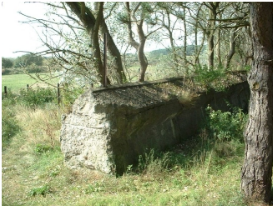
Foto 2. Anti-tankwal uit WO II.

In 1957 zijn plannen ontwikkeld voor het vergroten van het meertje met het oostelijke deel. Tegelijkertijd werden plannen gemaakt voor een theehuis (de Bokkedoorns) bij de westelijke plas en een parkeerplaats voor 110 (!) auto's op de plaats van de huidige manege. Pas als deze voorzieningen klaar zouden zijn dan zou het park worden opengesteld voor publiek.