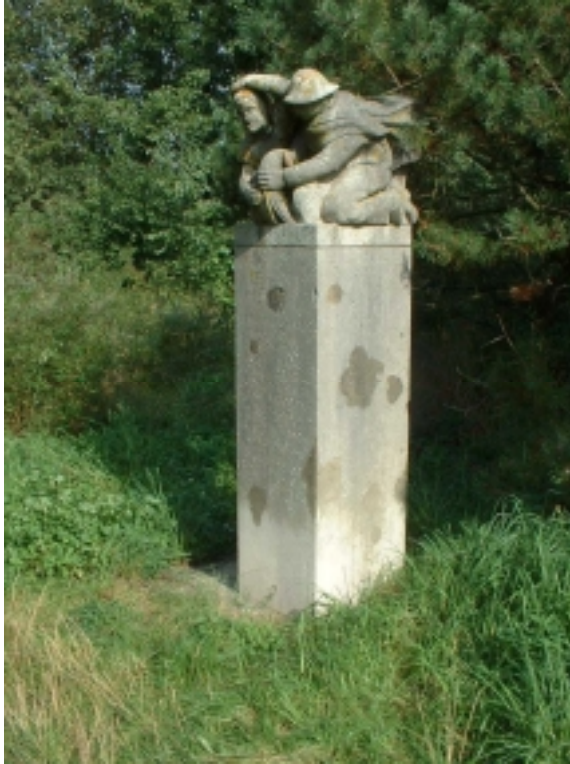
Foto 7 Het Helmplantersmonument