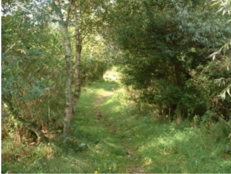
Foto 5. Loofbos langs de westelijke plas.

Vanaf de manege is er een informele ingang voor voetgangers het park in. Daar wordt echter weinig gebruik van gemaakt. Deze doorgang heeft verband met het gebruik van de parkeerplaats bij restaurant de Bokkedoorns door bezoekers van de manege. In dat kader moet ook de brug over de waterpartij voldoen aan eisen voor rolstoelen.