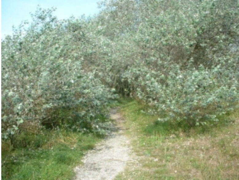
Foto 8. Kenmerkend bosje van Witte Abeel