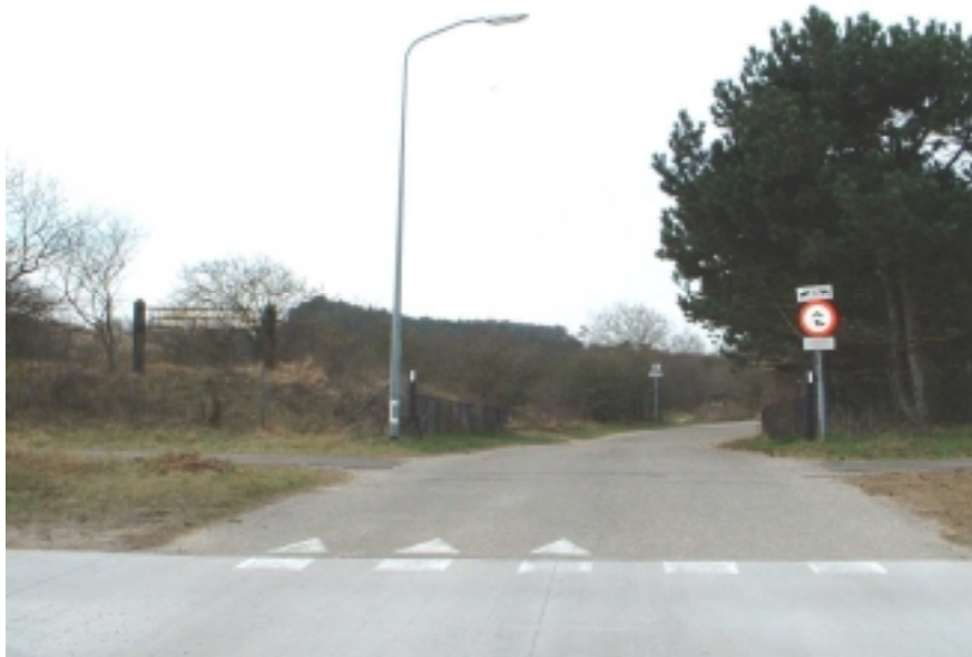
Foto 3. . Het is bij de ingang van het park niet meteen duidelijk dat hier een wandelpark is. (links het naambord).

De auto's en fietsers mogen alleen over het verharde pad naar het restaurant.