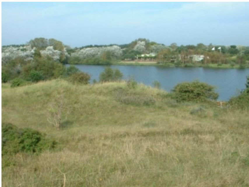
Foto 1. Het landschap van het Weth. Van Gelukpark

Naast het park en met een eigen ingang, ligt manege de Bokkedoorns.