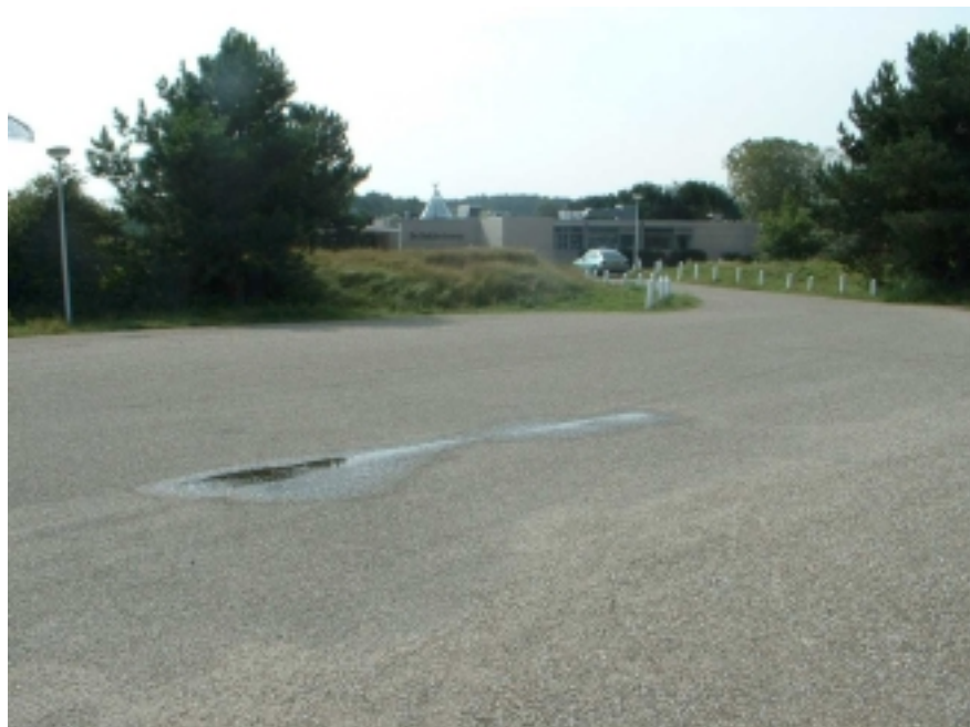
Foto 4. De grote geasfalteerde parkeerplaats bij de Bokkedoorns.

Nabij het restaurant ligt een grote geasfalteerde parkeerplaats (foto 4).