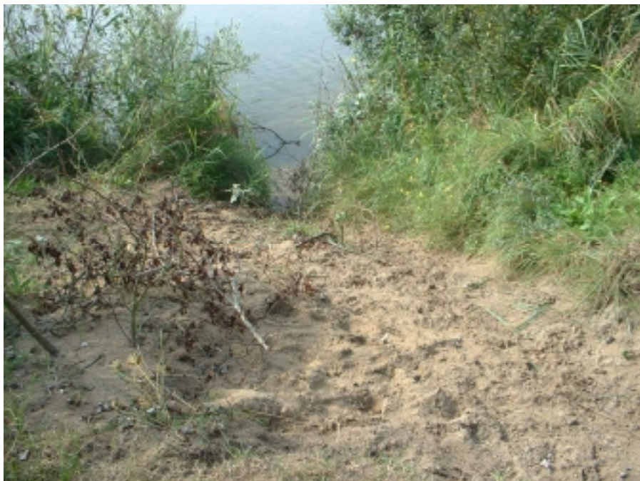
Foto 6. Visplek en hondendrinkplaats

De indruk bestaat dat er tegenwoordig ook minder vis in de waterpartij zit. Werd er voorheen veel paling uit het water gehaald, tegenwoordig gaat het om bescheiden recreatief vissen.