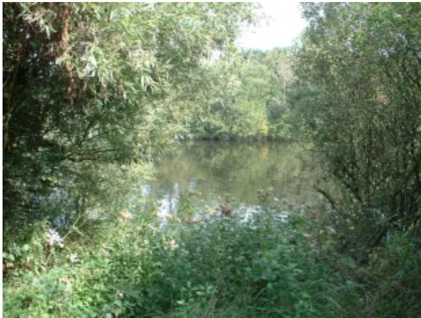
Foto 12. Het zicht op de westelijke plas moet verbeterd worden.

Bij voorkeur worden de vrijgekomen takken niet gebruikt voor het verbeteren van de paden, omdat dat verrijking van de bodem betekent. Een voedselarme bodem is juist het kenmerk van deze natuur. Hierdoor groeien er juist die bijzonder duinpalnten.