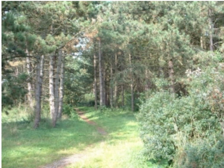
Foto 10. Het dennenbos

Een opmerkelijke vondst in het park is de Akeleiruit. Deze soort is vermoedelijk adventief (aangevoerd door mensen).