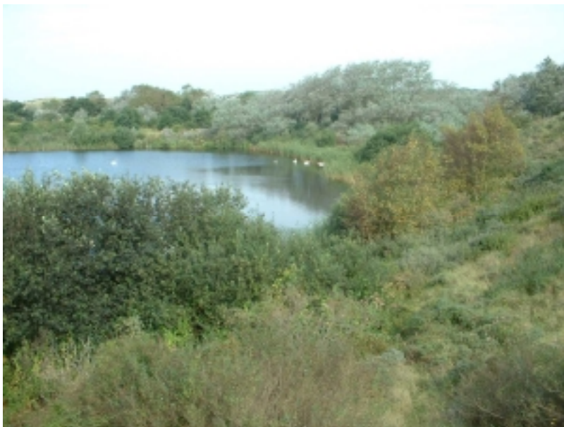
Foto 9. Verruigde oever

Aan de westkant van het park is een dennenbos aangeplant rond 1960 (foto 10). Dit was enerzijds bedoeld om het zand vast te leggen, anderzijds ook als houtproductie. In de ondergroei zijn nog diverse planten te vinden, die de oorspronkelijke vegetatie verraden. Voorbeelden zijn Duinsalomonszegel en Eikvaren. Behalve met dennen werd het zand na de zandwinning en de aanleg van het park ook vastgelegd met helmaanplant. De helmvegetaties zijn inmiddels overwoekerd met de plantengroei, die in deze duinzone thuishoort.